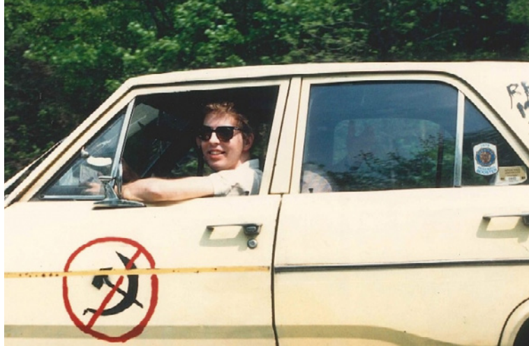
Kadrs no filmas «Valiant! Brauciens uz brīvu Latviju»

REŽISORE MĀRA PELĒCIS. 2021, DOKUMENTĀLA FILMA. 73 MIN.