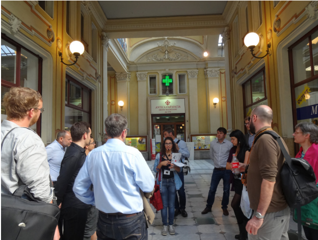
Migrantour Porta Palazzo tirgū, Kolombijas izcelsmes gīdes pavadībā

organizācija, kura piedāvā netipiskas pilsētu un rajonu apskates vairākās Eiropas pilsētās, kur imigrantu izcelsmes gidi izvadā tūristu grupas dalībniekus pa pilsētas imigrantu un viņu pēcteču rajoniem.