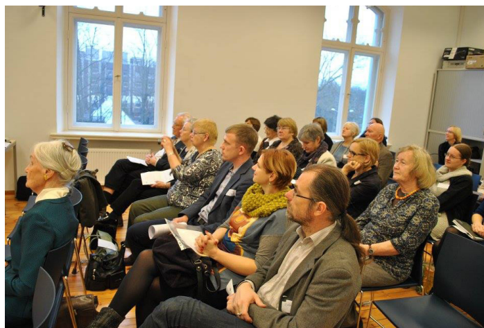
Pirmajā konferences dienā

Konferences pirmā diena bija veltīta Latvijas muzeju darbinieku priekšlasījumiem par to, kas saistībā ar izceļošanas un diasporas tēmu ir pieejams muzeju krājumos un skatāms ekspozīcijās, kā arī diskusijām par diasporas materiālu ekspozīciju nozīmīgumu un sadarbības iespējām to veidošanā. Konferences rīkošanu atbalstīja arī valsts pētījumu programma SUSTINNO (Latvijas Universitāte).