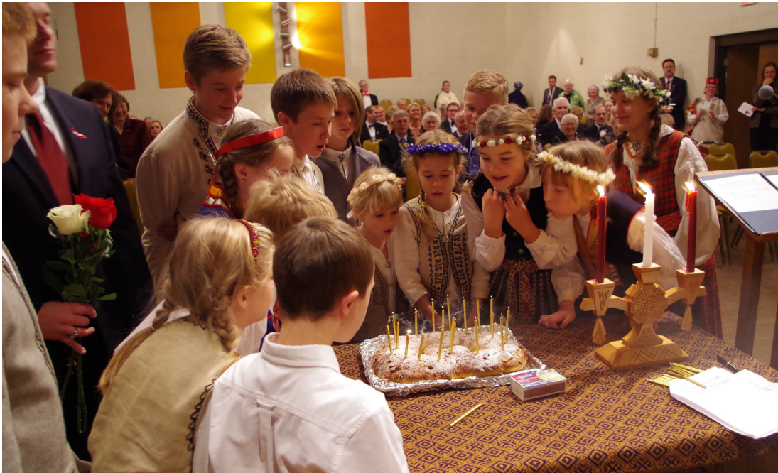
18. novembra svētki Milvokos, ASV (sk. 8 lpp.)