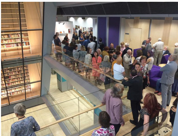
Kanādas izstādes atklāšana

1. jūlijā, Kanādas dienā, muzejs un pētniecības centrs „Latvieši pasaulē” (LaPa) kopā ar gandrīz 60 viesiem Latvijas Nacionālā bibliotēkā Rīgā atklāja izstādi “ Kanādas latvieši: Muzeja “Latvieši pasaulē” jaunieguvumi ”.