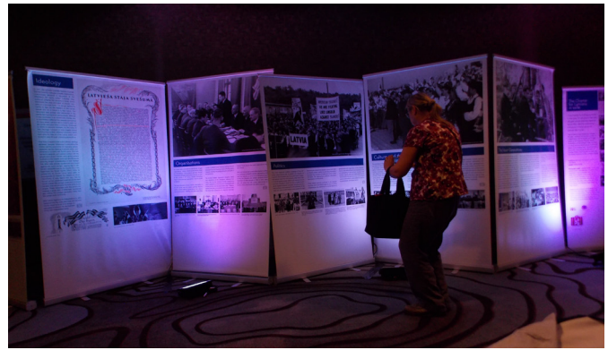
"Latviešu stāja svešumā" izstāde Sanhosē