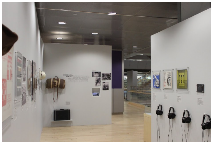
Kopskats ar austiņām, kur varēja klausīties Kanādas latviešu mūziku.

treālā, Otavā, Hamiltonā, Kičenerā-Vaterlū un Toronto. Ekspedīcijas laikā tika pārņemtas 2000 fotogrāfijas no ģimeņu arhīviem, muzejam sadāvināti daudzi priekšmeti un fotogrāfijas, kas atspoguļo Kanādas latviešu kopienu dzīvi, kā arī ierakstītas vairākas intervijas. Sadarbībā ar Latvijas Nacionālo bibliotēku savāktās fotogrāfijas pašlaik tiek digitalizētas un drīz būs pieejamas ikvienam interneta datu bāzē.