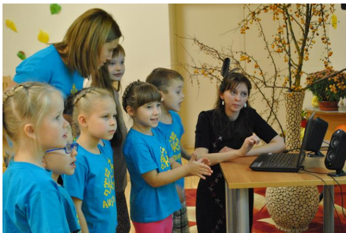
Mājas lapas atvēršanā „Austriņā”