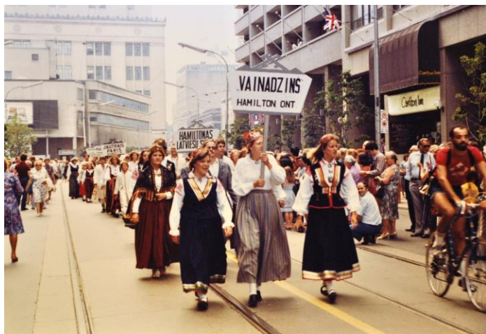
Hamiltonas deju kopa „Vainadzījš” Dziesmu svētku gājienā Toronto 1981.gadā.

Pirmā „Latvieši pasaulē” tematiskā kolekcija, kura tiek ievadīta datu bāzē, ir fotogrāfijas no Kanādas latviešu dalības dziesmu svētkos ārpus Latvijas. Ir paredzēts, ka līdz 2015. gada vidum jau vairāki simti šīs kolekcijas fotogrāfiju būs aplūkojamas internetā. Šāda veida attēlu vākšana, apstrāde, izpēte un informācijas ievadīšana ir laikietilpīgs darbs – it īpaši, ja mērķis ir publicēt vizuāli korektu fotogrāfiju, ar precizētu