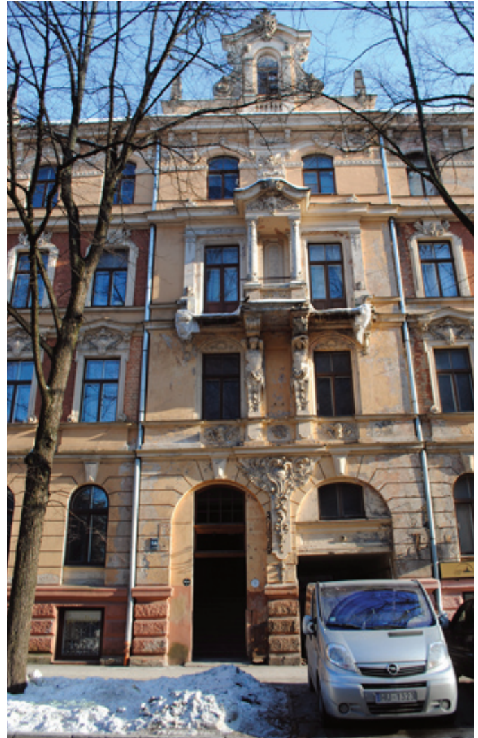
„Latvieši pasaulē” jaunais birojs atrodās Ausekļa ielā 6A