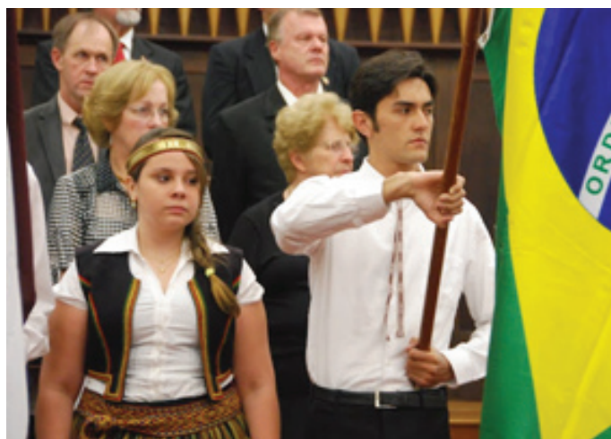
18. novembra svētki Nova Odesā

Ekspedīcijas dalībnieki apbrīvoja Brazīlijā dzimušos latviešus (paši sevi viņi sauc par pēcnācējiem, jo latvietis esot tikai tas, kurš dzimis Latvijā), kuri vēl arvien dzied latviešu dziesmas (gan tradicionālās, gan baptistu), spēlē dažādus mūzikas instrumentus, runā un lieto vārdus, kas raksturīgi Latvijas reģionam, no kura izceļojuši viņu vecāki vai vecvecāki, kā arī svin Latvijas valsts dibināšanas svētkus – 18.novembri. Iespaidīgs bija arī pats Vārpas ciems, kas atrodas 8 stundu brauciena attālumā no metropoles San Paulo, ceļš ved garām cukurniedru laukiem un kafijas pupiņu fazendām. Ciemā dzīvo apmēram 800 iedzīvotāji, no tiem liela daļa jau ir brazīlieši, taču galvenajā ielā „Avenida Brasil” atrodas mājas ar uzrakstiem latviešu valodā: „Dievs tevi milē”, „Agrākā aptieka”, „Darbnīca” utt. Pēdējos gadu desmitos latviešu skaits un ietekme Vārpā ir stipri mazinājusies, jo liela daļa latviešu jaunībā Vārpu pameta, lai izglītos vai dabūtu labāk atalgotu darbu. Daudzi īpašumi, kuri agrāk piederējuši latviešu ģimenēm, tagad