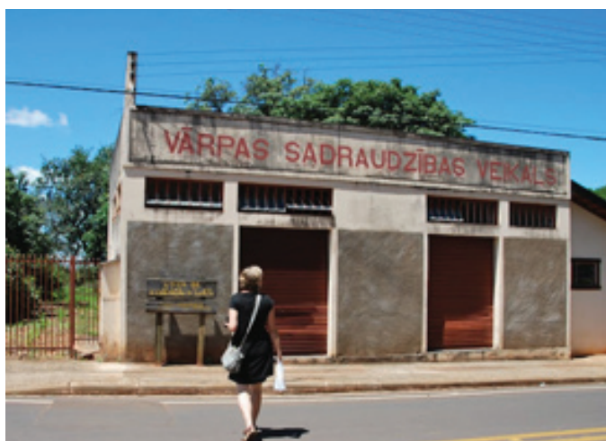
Vārpas galvenā ielā „Avenida Brasil”