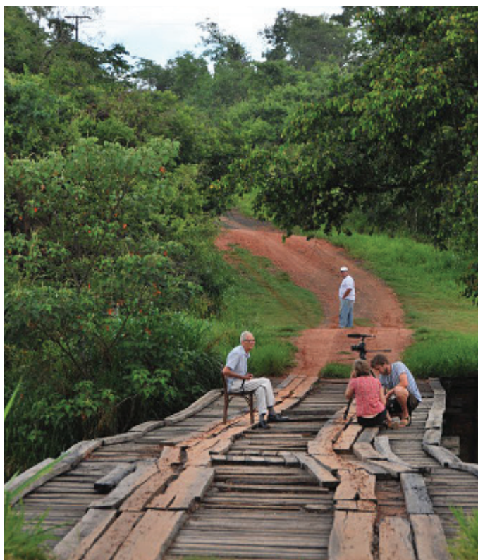
Filmējot Jāni Dzeni pie Vārpas „vecā lēģera” vietas