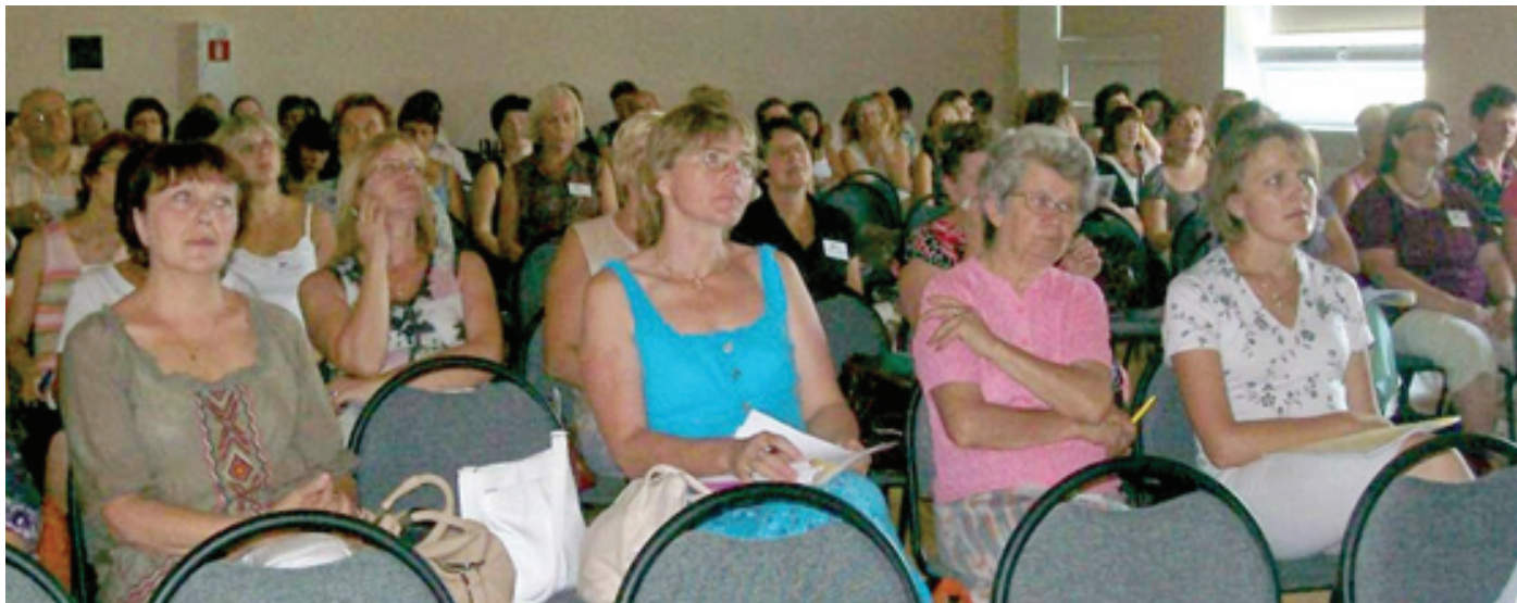
Latvijas vēstures skolotāju biedrības semināra klausītāji

Sadarbībā ar Latviešu fondu (ASV) notiek Latviešu fonda arhīva dokumentēšanas projekts. „Latvieši pasaulē” krājumā nonāks priekšmeti no latviešu fonda īstenotajiem projektiem, iespējams nākotnē no šiem priekšmetiem tiks izveidota izstāde („Latviešu Fonda arhīva digitalizēšanas Projects”, 11.lp. ).