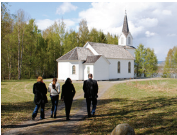
Norvēģu Emigrantu muzeja teritorijā

Brauciena pēdējā dienā K.Djupedāla pavadībā devāmies apskatīt citus Norvēģijas muzejus -