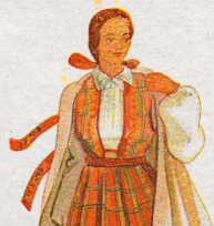
Exhibit will debut in Rīga during the Latvian Song and Dance Festival 2023.

Showcasing the weavers, the sewers, the wearers, the stories of Latvian folk costumes abroad.