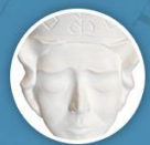
PORCELĀNA SEJA Veira Pjūke-Pjūks