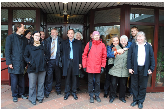
Minsteres semināra dalībnieki

pieminēja to, ka Eiropai ir vajadzīgas kopīgas datubāzes, tāpēc informācijas sakopošana un pieejamības nodrošināšana ir mērķis, par kuru nākotnes perspektīvā būtu jādomā. Bez konferences programmas pasākumiem spilgtu iespaidu atstāja Frenka Ģērja (Frank Gehry) projektētais Ģugenheima muzejs Bilbao, unikāls objekts – muzejs – kura dēļ sākās visa reģiona ekonomiskā atplaukšana. „Latvieši pasaulē” ieguvums no šīs ikgadējās konferences ir pieredze, kuru uzzinām no citiem līdzīgu tēmu muzejiem. Tāpat bija vērtīgi salīdzināt mūsu emigrācijas vēstures pieredzi ar citu valstu informāciju.