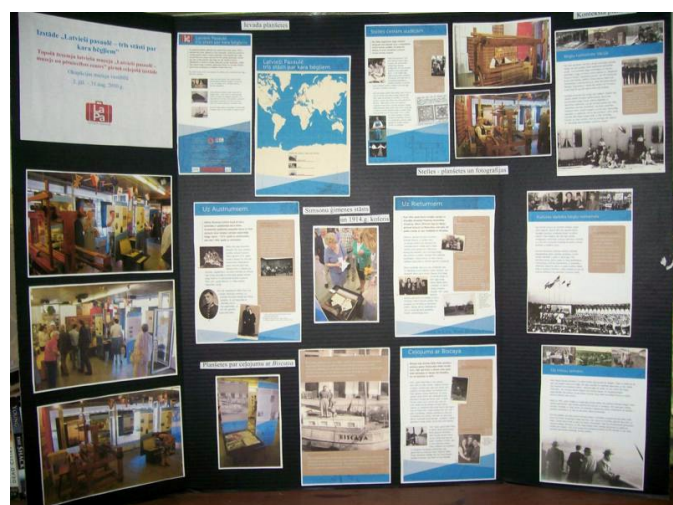
Plakāts par izstādi „Latvieši pasaulē - trīs stāsti par kara bēgļiem”

Mēs to mēģinām darīt ar mūsu izstādēm, brošūrām, avīžu un interneta rakstiem, preses relizēm, prezentācijām dažādos forumos, plakātiem, piedalīšanos radio programmās, kā arī ar DVD palīdzību un piesūtot pārskatus par mūsu darbību uz vairākām elektroniskām ziņu listēm. Vienmēr informācija par LaPa notikumiem ir pieejama mūsu mājas lapā www.lapamuzejs.lv un arī Facebook - „Latvians abroad – museum and research centre”.