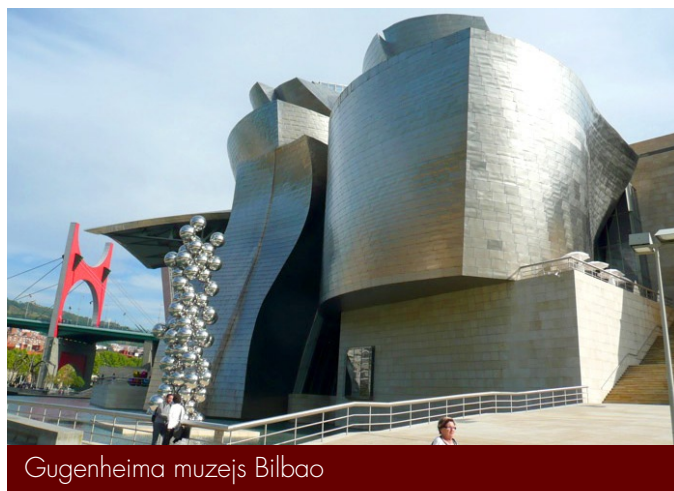
Gugenheima muzejs Bilbao

pieejas un iestrādes arhīvu krājumu digitalizācijā un pieejamībā internetā. Sarunās nereti