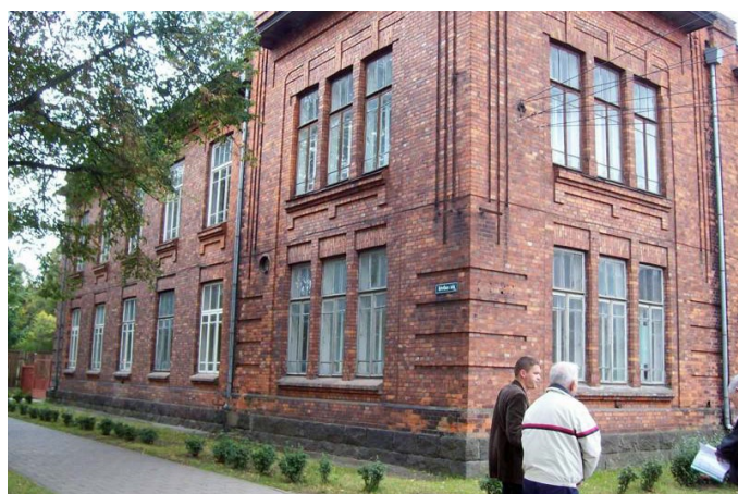
Ēka Dzelzceļnieku ielā, Liepājā