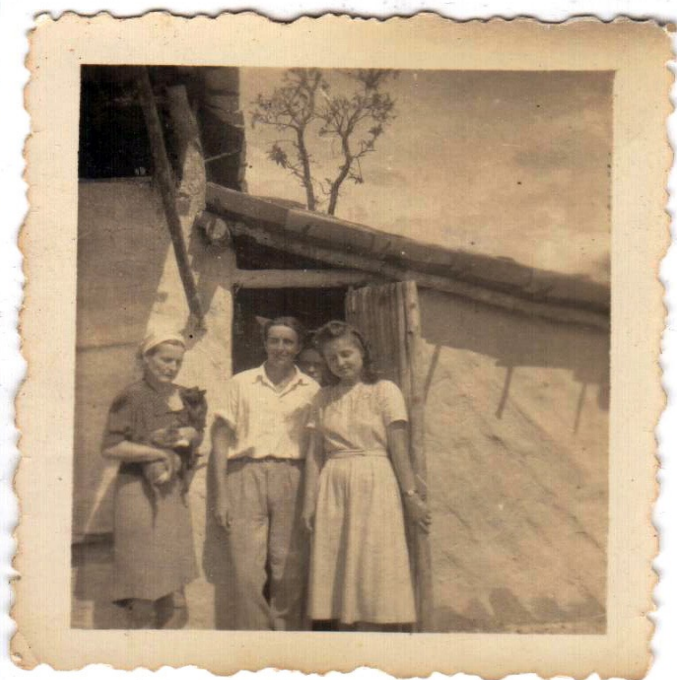
Pirmie pēckara gadi Brazīlijā

„Latvieši pasaulē” (LaPa) svarīgākais uzdevums ir vākt, pētīt, uzglabāt un pēc tam arī darīt pieejamus publikai dažādus materiālus, kas liecinātu par izbraucējiem no Latvijas dažādos laikos un uz dažādām vietām. Šai ziņā darba lauks ir neapmierams liels, jo pēdējo 200 gadu laikā milzīgs skaits Latvijas cilvēku visdažādāko iemeslu dēļ ir izkaisīti visā pasaulē. Minēšu vien dažas no lielajām izbraukšanām: izbraucēji uz Krieviju un Sibīriju zemes meklējumos 19. gadsimta beigās – 20. gadsimta sākumā, izbraucēji uz Brazīliju zemes meklējumos un reliģisku iemeslu dēļ 20. gadsimta sākumā, Otrā pasaules kara bēgļi, mūsdienu izbraucēji darba un labākas dzīves meklējumos. Tas rosina mums meklēt atbildes uz jautājumiem – ar ko sākt, ko vākt un kāpēc? Tā kā