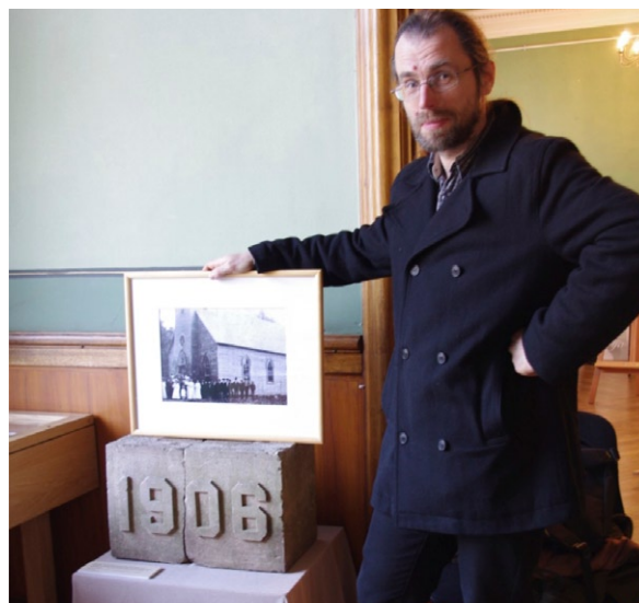
Linkolnas (Viskonsinā) Latviešu baznīcas stūrakmens