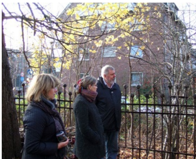
Ekskursija pa latviešu atstātajām pēdām Minsterē